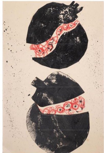
крафт, масл. пастель, акрил