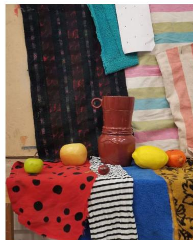
Натюрморт «Коллаж» Ткань, бумага, крышки и т.д ,40x50