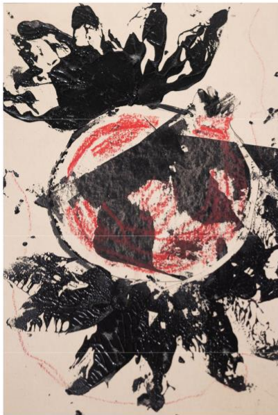
крафт, масл. пастель, акрил