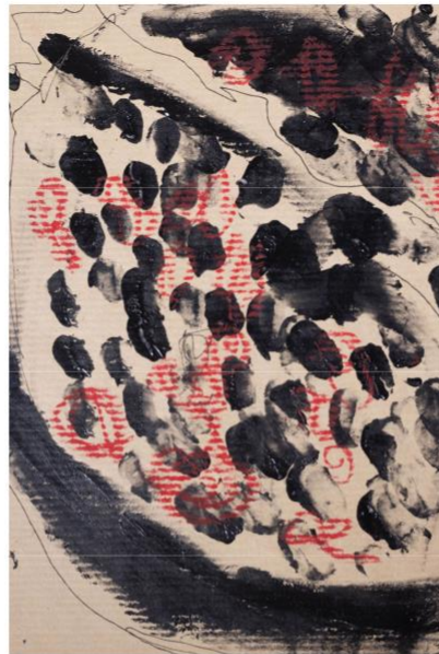
крафт, масл. пастель, акрил