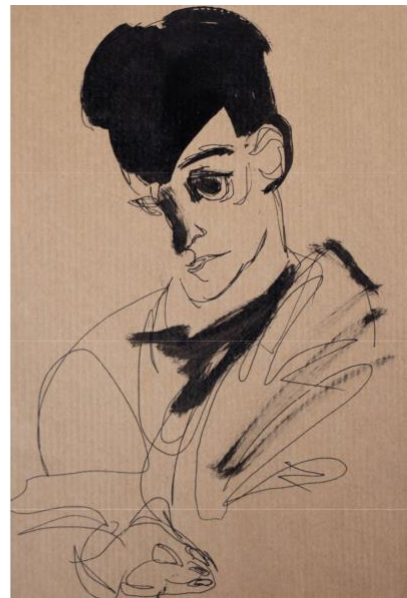
крафт, линер, акрил