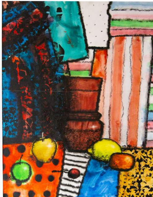
Натюрморт «Живопись и черно-белая графика» Акварель, бумага, масл. пастель, 40x50