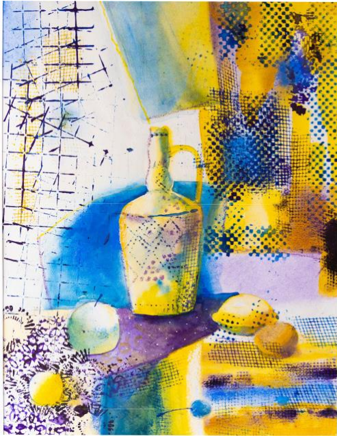
Натюрморт «Трёхцветный» Акварель, бумага, 40x50