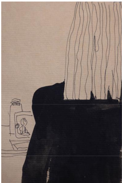
крафт, линер, акрил